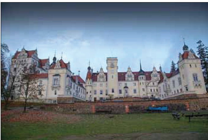
Schloß Boitzenburg, ein ehrwürdiges Probelager der brandenburgischen Bläserklassen