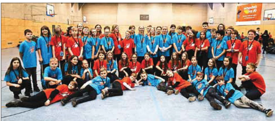
Bläserklassen Guben 2019