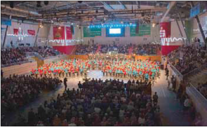
Blick in die die MBS Arena in Potsdam